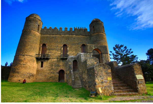
King Fasilidas Palace