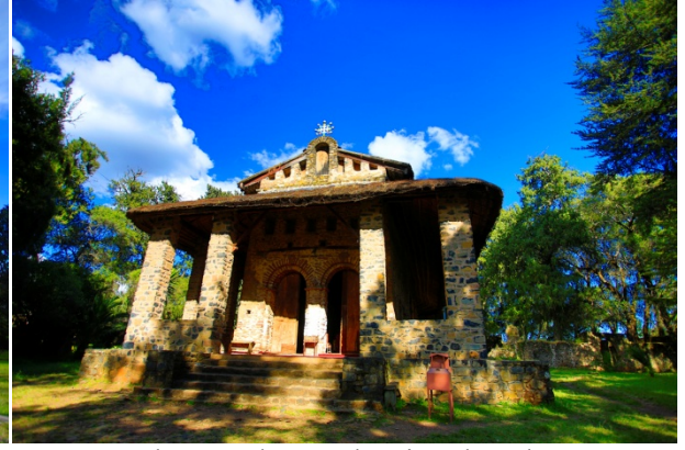
Debre Berhan Selassie Church

第 6 日 貢德*—維萊卡村 Wolleka Falasha Village—西米恩國家公園 Simien National Park* (Jan. 27)